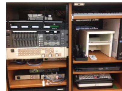
IT教卓内には、講義収録システムをはじめ、さまざまな情報通信機器がコンパクトに収納されている