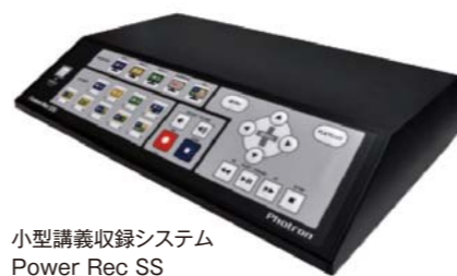
小型講義収録システム Power Rec SS

『Power Rec SSは、教員が一人で簡単なコンテンツを生成できるため、講義の様子を振り返るコンテンツ、卒論発表会・修論発表会やFD講演会、他大学との遠隔講義など、通常の講義だけではなく多様なコンテンツが作成されるようになりました。収録・編集作業に人員を割けないが、コンテンツを作成したいというニーズは多くあると思います。高付加価値コンテンツだけでなく、対象をしばったコンテンツ作成も引き続きフォトロンには支援して欲しいと思います。』